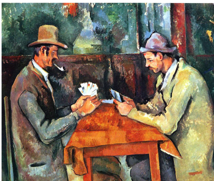
I giocatori di carte, Paul Cézanne 1893-1896

«Il poker online è pensato per attrarre i più giovani. Sì, sono preoccupato per la crescita del gioco compulsivo».